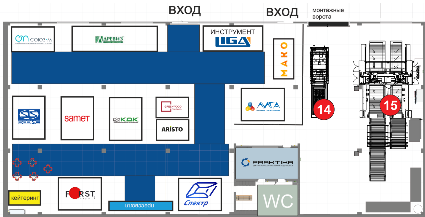
Схема зала промышленного оборудования для производства мебели